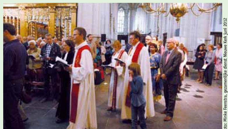
gezamenlijke dienst Nieuwe Kerk juni 2012