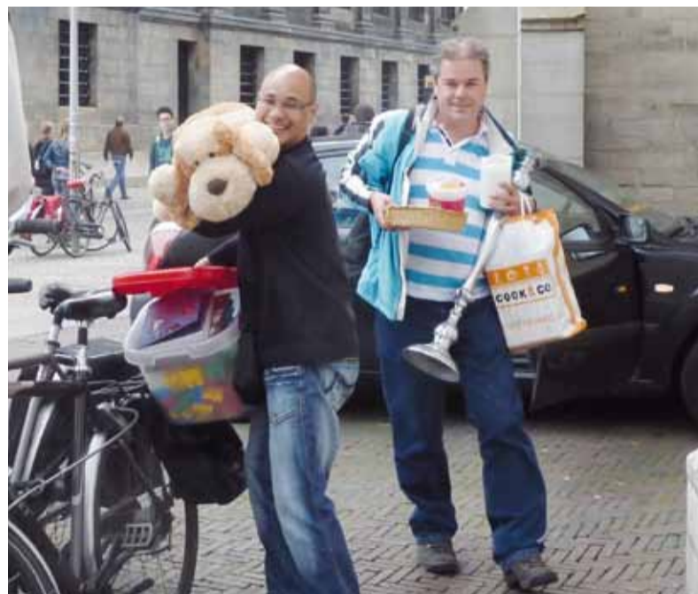
Geloof in uitvoering!

Zie verder: www.protestantsamsterdam.nl/geloofscursussen