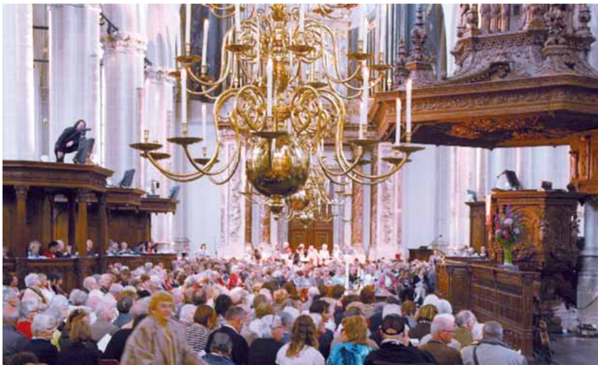
Meer dan de helft van de betrokken leden van de Protestantse Kerk Amsterdam ziet God als Schepper van hemel en aarde

Ook de vraag naar de rol van geloof in het dagelijks leven, komt terug in de enquête. Zo hoopt iemand dat het geloof haar op de weg van compassie en humaniteit houdt.