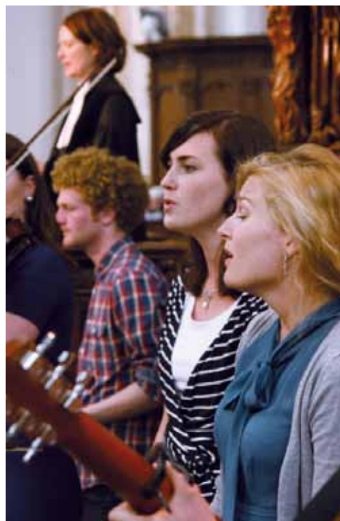
De grootste groep voelt zich aangesproken door de liturgie, liederen en muziek

De leden zijn trots op de volhouders, het nieuwe elan en de openheid. Tegelijkertijd is er ook een verlangen naar een kerk die minder bureaucratisch en afstandelijk is, een kerk die meer omziet naar elkaar, een kerk waar jongeren, lager opgeleiden en gezinnen een plek vinden. Een aantal leden geeft aan dat de kerk kritischer of meer belijdend mag zijn.