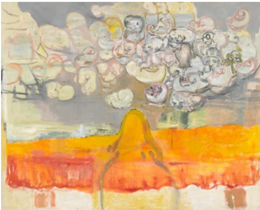
onderlinge uitwisseling in 3 a 4 kringen