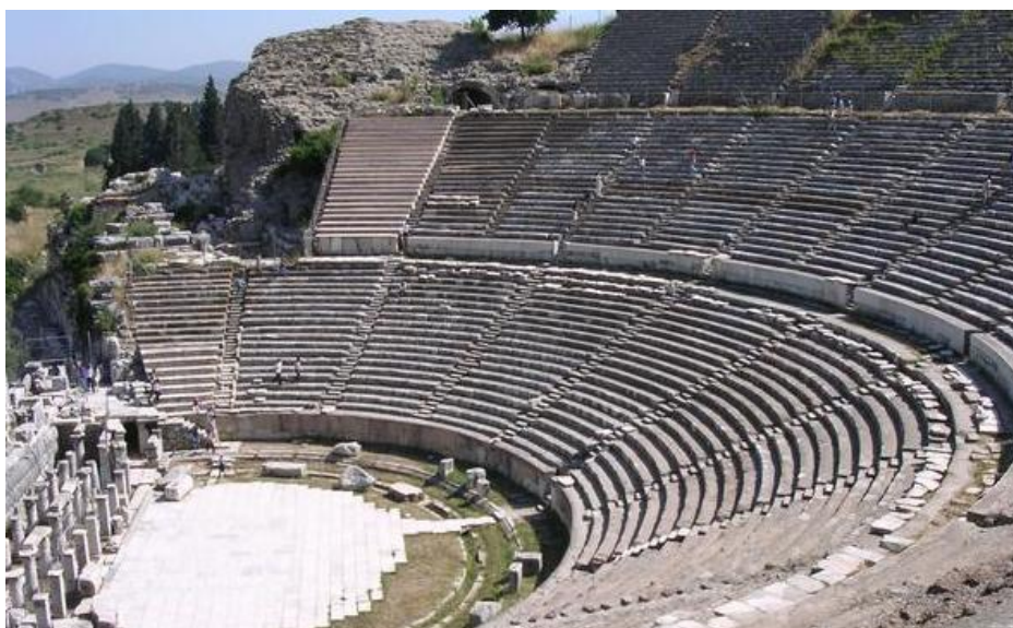
Het amfhitheater in Efeze waar Paulus preekte