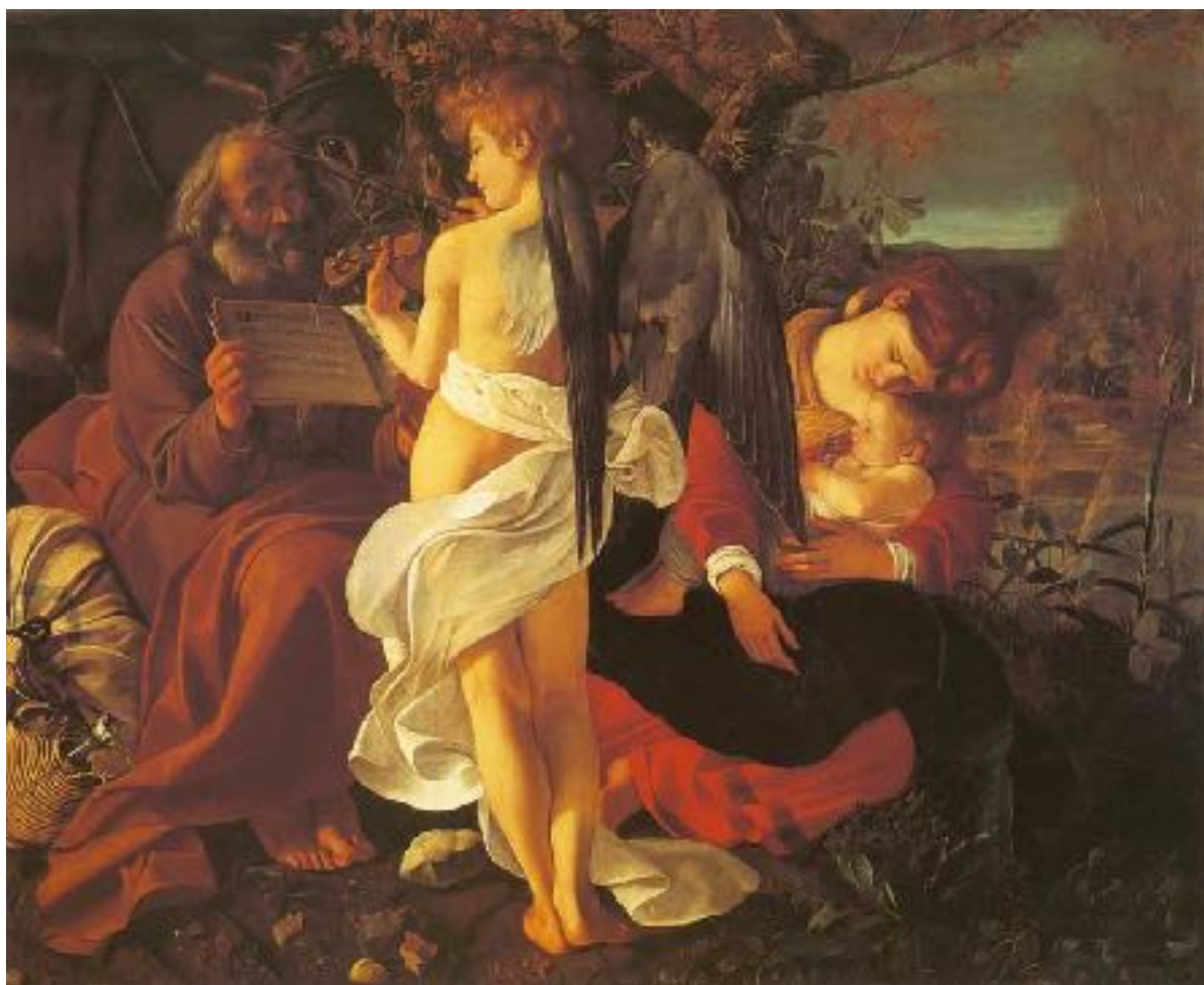
Caravaggio, Vlucht naar Egypte ca. 1595