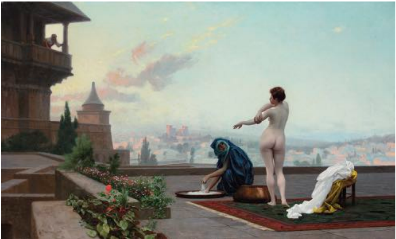
Batseba, Jean-Léon Gérôme 1824 - 1904