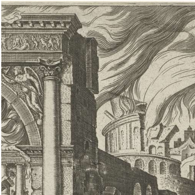
Sodom en Gomorra (Rijks museum) Philips Galle, naar Maarten van Heemskerck 1569