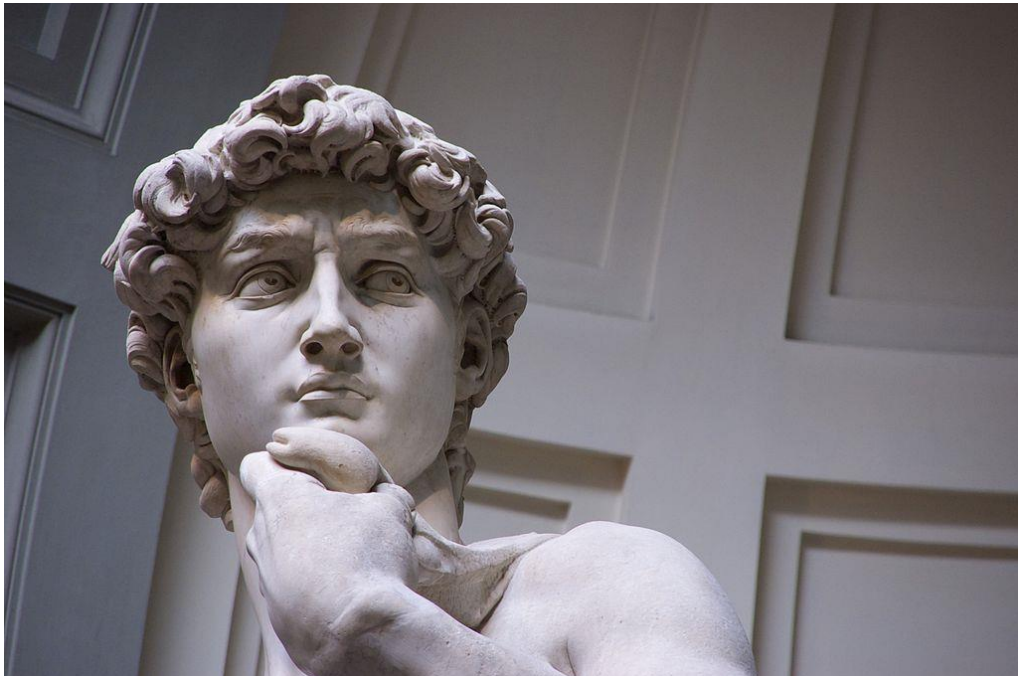
Het leiderschap van koning David