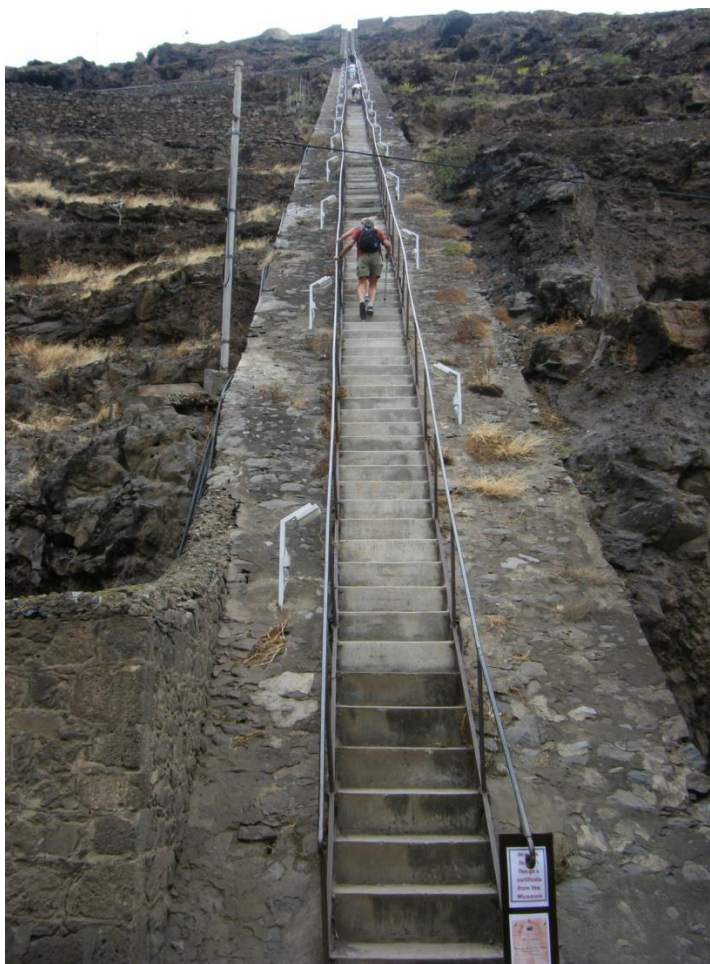
La "Escalera de Jacob", Jamestown, Santa Helena