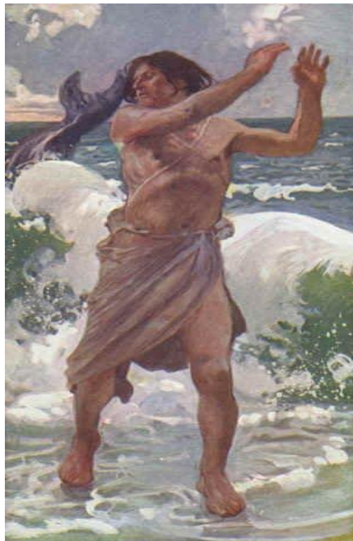
James Tissot, Jona