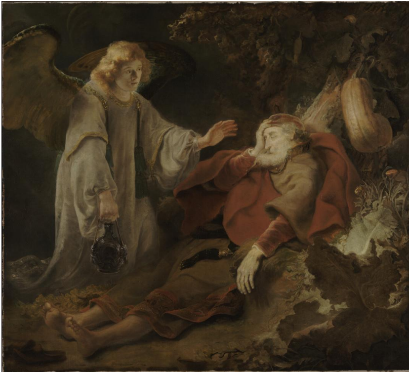
Ferdinand Bol, de engel verschijnt aan Elia