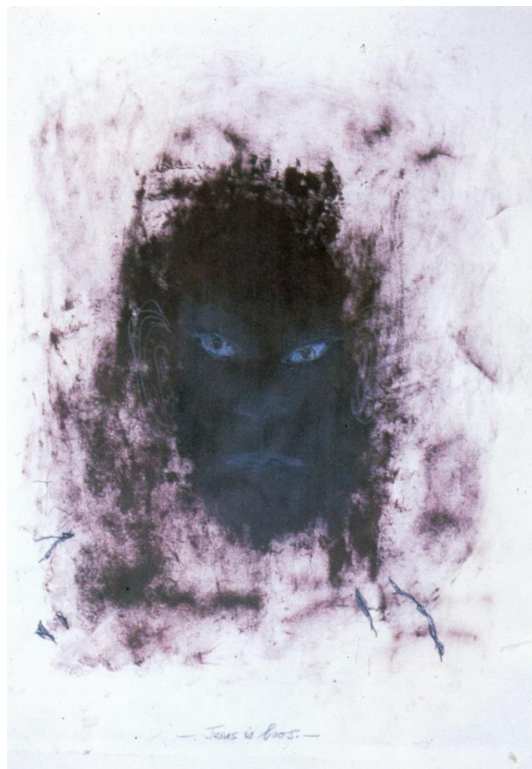
Jezus is boos, Marlene Dumas