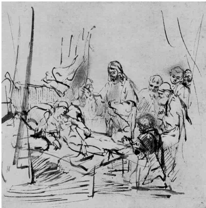
Rembrandt, Jezus en de dochter van Jairus