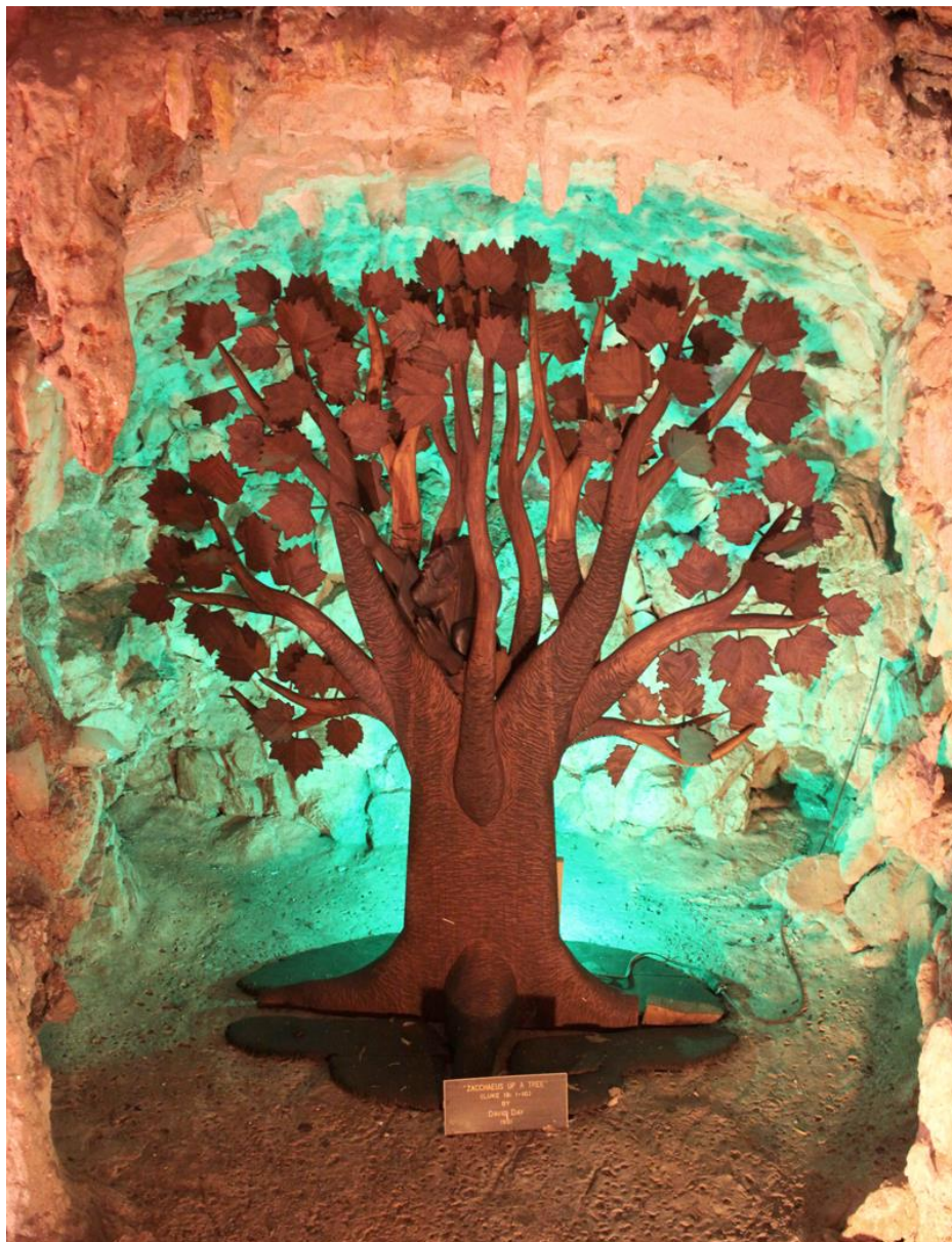
David Day, Zacchaeus up a tree